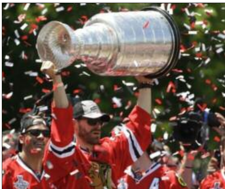
Hokejista Chicaga Blackhawks Slovák Michal Handzuš dvíha nad hlavu prestížnu trofej počas osláv zisku prestížneho Stanleyho pohára v Chicagu.