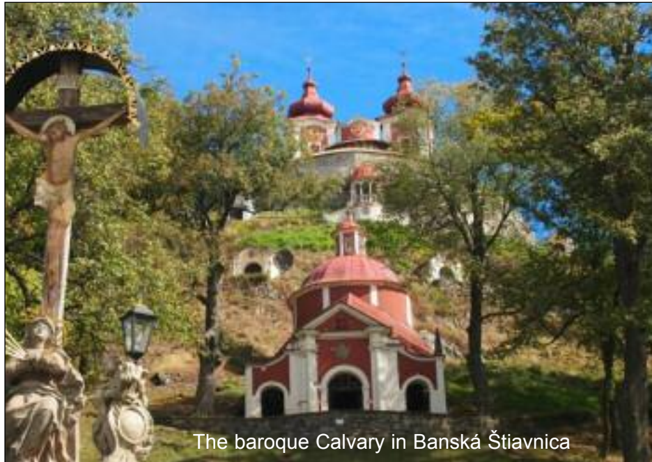
The baroque Calvary in Banská Štiavnica

The cruelties of the communist regime are evidenced in the story of the first beatified woman in Slovakia. Sister Zdenka, civilian name Cecilia Scheling, grew up in the village of Krivá in the Orava region in the 1920s. In 1952 she assisted several Catholic priests in escaping from the former Czechoslovakia. The communist secret police imprisoned and tortured her on the grounds of treason. She was released in 1955 but died just months later. After the fall of the regime, Pope John Paul II asked believers to collect materials and spread the testimony of people who suffered for their religion.