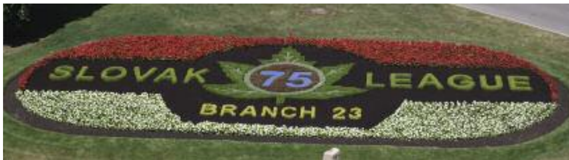
Floral bed photo - courtesy of City of Welland"

On October 6, 1940, they organized the Canadian Slovak League Branch 23 of Welland. Traditions, heritage, language and love of their birthplace, had kept newly arrived groups of Slovaks united, and over the next several years, their membership grew. In 1944, they purchased their first hall which was located on the corner of King and Lincoln Streets. In 1951, they purchased a hall, naming it the Slovak Hall, at 162 Hagar Street. For over fifty years, the Slovaks of Branch 23 worked hard to keep their hall running and enjoyed many celebrations and performances there. It was enjoyed by all and was their place to come together and socialize, creating many wonderful memories. Over the