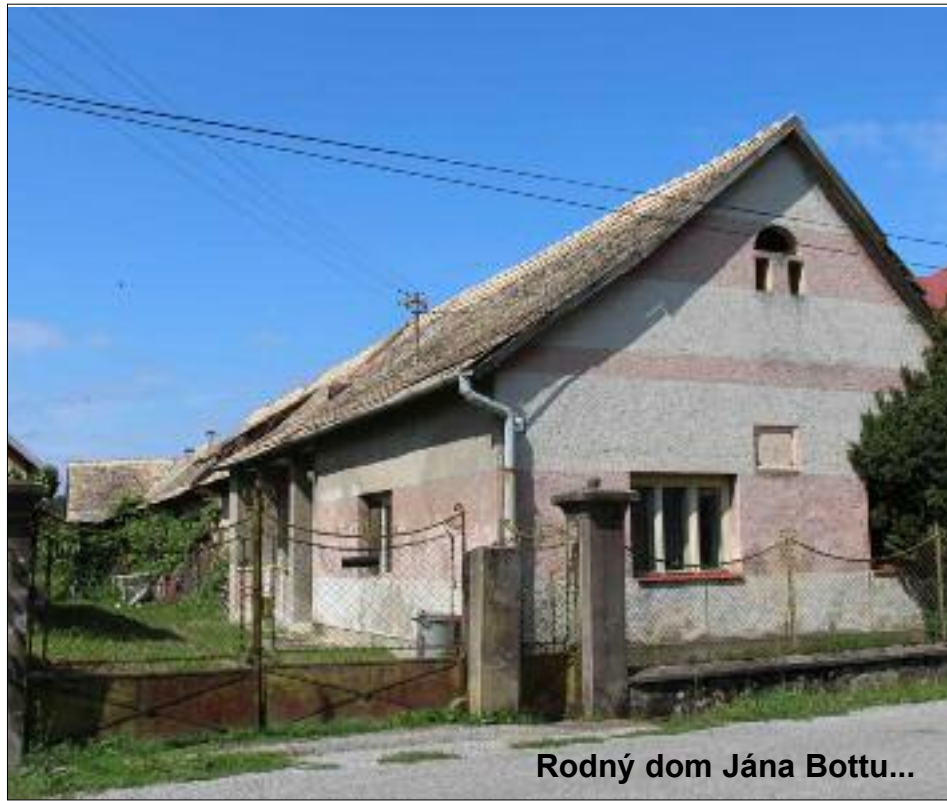
Rodný dom Jána Bottu...