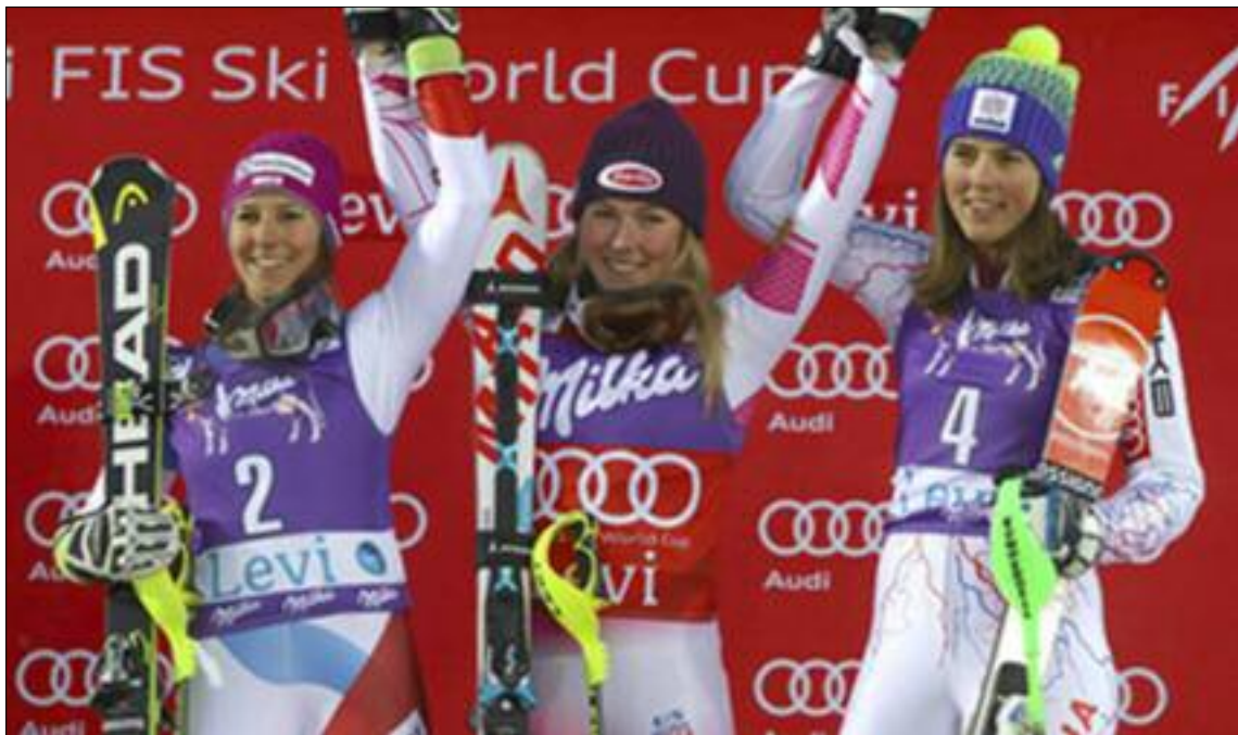
Winners of Alpine skiing in Finland: winner US Mikaela Shiffrin (C), second Swiss Wendy Holdener(L) and third Petra Vlhová (R) on November 12.

ing both of them receiving medals. Vlhova wrote on Facebook that it seems this season will be full of success; and that she hopes they – her and Velez Zuzulová – will be even stronger than in last season. Vlhová had the second fastest time of the second round (after being fourth in the first round) in Levi. She explained for Sme she was more careful in the first round – as this was the very first race. “It is a good start but I would be satisfied if I won,” she added. For Velez-Zuzulová, this was the best achievement at this ski resort in her career – fifth place was her best in Levi so far. “It is my best achievement in Levi, but I wanted more,” she said. “I made some mistakes in both rounds. I want to get better and better in each race.”